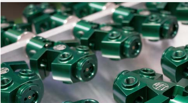
ZT Odenwald produziert vorrangig kleine und mittlere Serien, Prototypen, Sonderanfertigungen & Einzelstücke aus Aluminium, Edelstahl, Stahl, Messing und Aluminium-Bronze für Kunden im Maschinen- und Anlagenbau.

Erbach, Oktober 2022. – Mittelständische Zulieferer, die spangebend gefertigte Bauteile aus Metall anbieten, gibt es hierzulande reichlich. Rasch aber lichtet sich das Feld, wenn die Anforderungen an die Genauigkeit steigen, wenn einbaufertige Komplettlösungen gewünscht sind oder wenn der Kunde zusätzliches Knowhow in Sachen Zerspanungstechnik in Anspruch nehmen muss. Dann nämlich sind Unternehmen wie ZT Odenwald gefragt, die nicht nur mit hohen Kompetenzen auf den Gebieten der Fräs-, Dreh- und Graviertechnik punkten können, sondern ihren Kunden partnerschaftlich zur Seite stehen – von der Kalkulation über die Konstruktion bis zur Herstellung von Einzel- und Serienteilen.